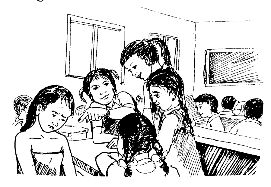
मेभेना उङा इस्कूल सीता।

ओकपो कमबी मारी दुक गोता। गोक्वाप उनाना क्वाम्ना मचाप्पा, कपी कलम उना मचाप्पा मुक्तका। मेफेम दुक येम्तोङ धीमालनीमहामआ कमबी पोकीम गो क्वाप्तना इस्कुल खोस्थेरता। अदरमहामआ अगोका मारी सेम्ला इमुस्थेर्तनु।